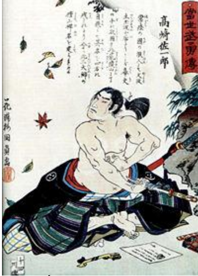
Một kiếm sĩ Nhật đang sửa soạn nghi thức harariki

Có lẽ nhiều người biết đến tục mổ bụng harariki của giới hiệp sĩ đạo Nhật, harariki thật ra là âm Nhật (so với âm Nôm/nôm na) của từ Hán 切腹 thiết phúc (cắt bụng) seppuku nhưng đọc ngược lại (thứ tự chữ ngược); từ ghép haramaki là miếng (vải) bao bụng cho khỏi lạnh... Xem qua vài từ ghép với hara như